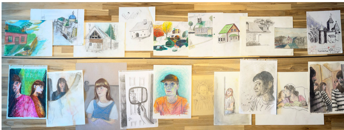
Figure 3 La série d'autoportraits et de maisons

la recherche. Je ne ressens pas ce deuil comme une série d'étapes à terminer. Il s'agit plutôt de dimensions nouvelles de mon identité que je cherche à intégrer.